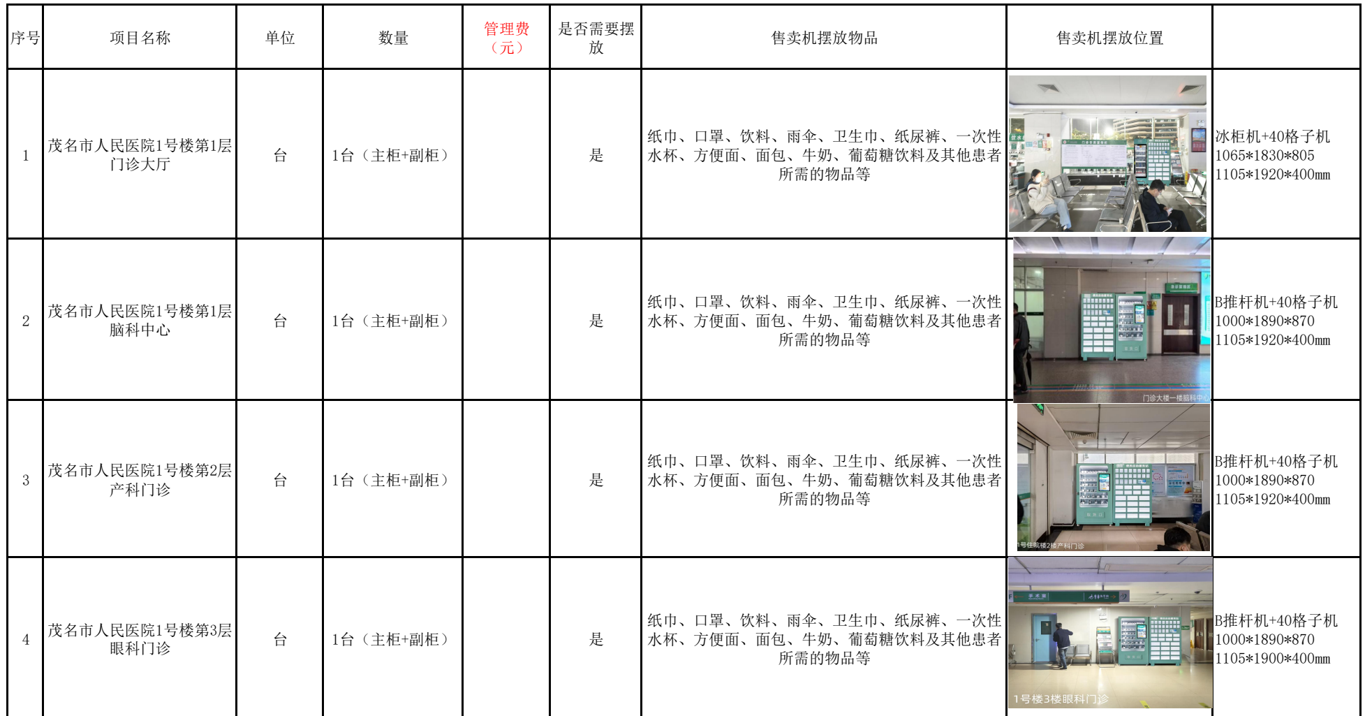
自助售卖机场地分布情况A包